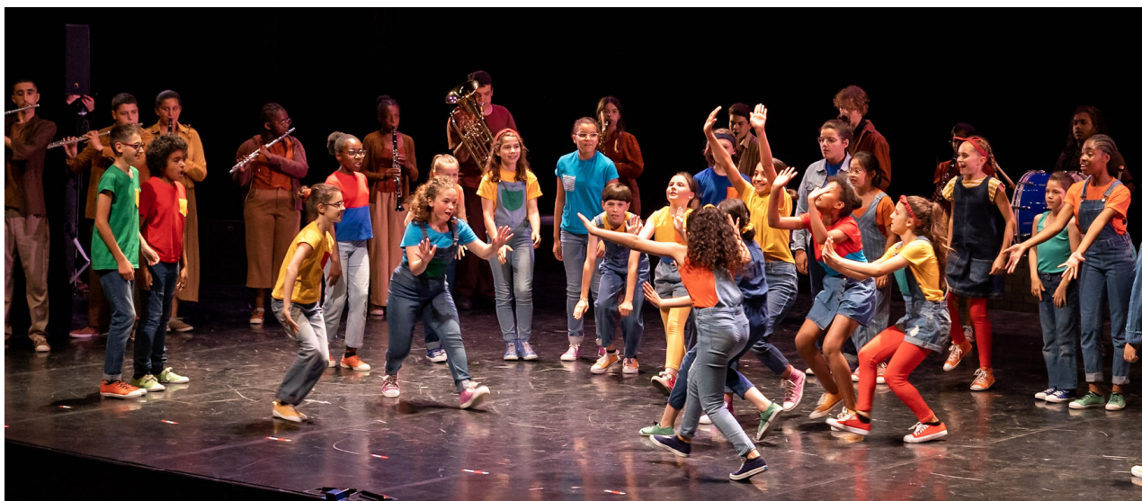
Comédie musicale De l'autre côté du mur par le CRÉA et Orchestre à l'école, Opéra de Massy, 2022