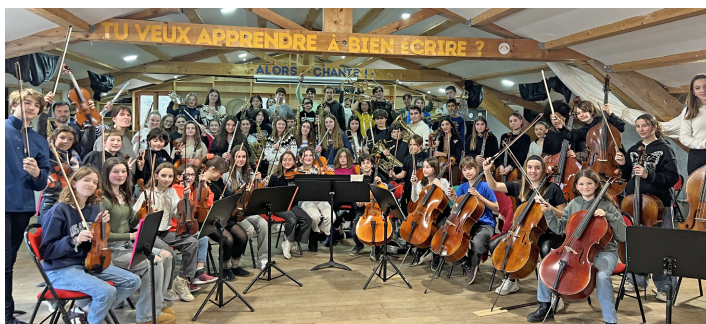
Les orchestres et les musiciens référents en répétition